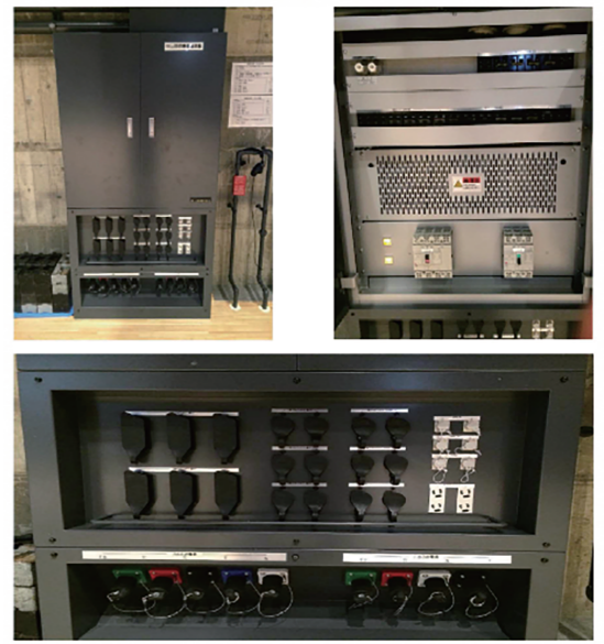
持込照明機器電源盤 (上手×1・下手×1)